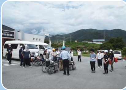
北杜消防署と連携