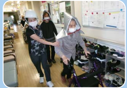
水消火器で消火訓練