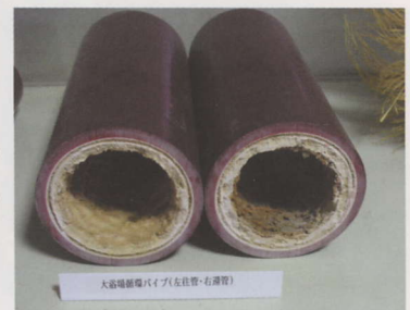
内側1cm位は温泉成分の付着

通路にあるショーウィンドウをご覧になりましたか？ 定期的に取り換えている給湯管の断面を見てもらうためのサンプルです。内側に10mm位に白くこびりついているのは温泉成分です。それだけ成分含有量が多いのです。ぜひ一度ご覧ください。お客様に喜ばれる温泉は、管理が大変なのですよ。