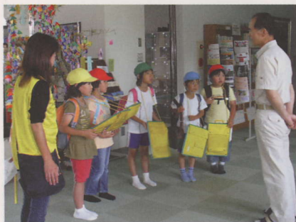
泉小 町体験のひとつ

終わった後の疲れを取りに、あるいは地区の行事の会場として、囲碁の自称名人の決戦の舞台としても利用されています。