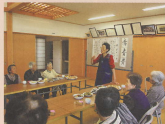
頭を働かせながらレクリエーション