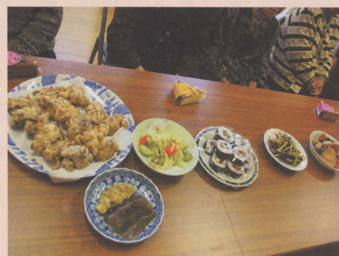
おいそ〜な手作り茶菓子