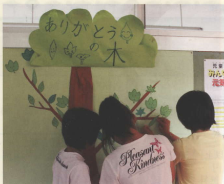
やさしい気持ちを育む「ありがとうの木」

毎日給食で飲んでいる牛乳。牛乳パックを、「燃えるゴミ」として出すことはできます。でも、中を洗って乾かせば、「リサイクルごみ」になるのです。「リサイクルごみ」として出された牛乳パックは、古紙リサイクルセンターに行き、トイレトーパーやノートに生まれ変わります。牛乳パックの原料である木を少しでも守るために、牛乳パックをリサイクルしています。洗って乾かすという子どもたちにとって手間のかかる作業でも、「資源を大切にしたい」という思いで続けています。