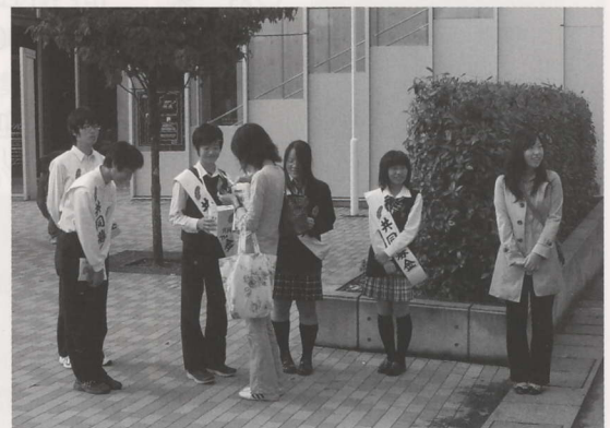
甲陵高校生による街頭募金活動（長坂駅前）