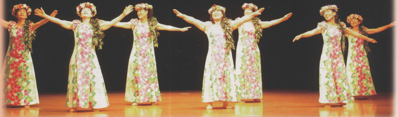
武川町フラダンスグループ「ハイビスカス」