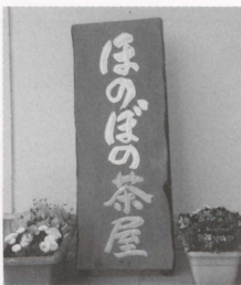
この看板が目印です