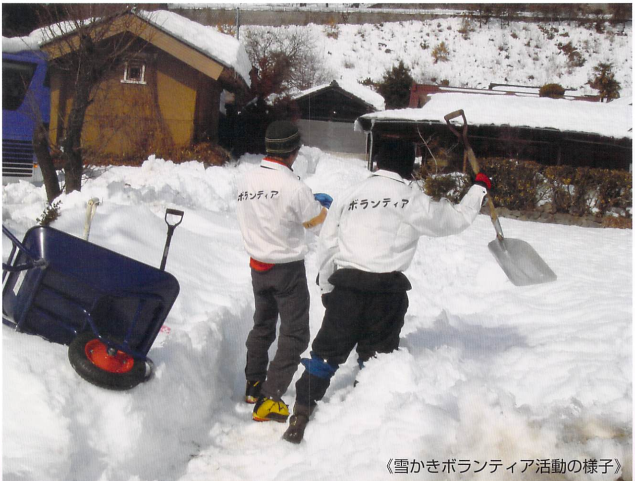
《雪かきボランティア活動の様子》