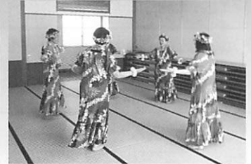
会議室と和室があります