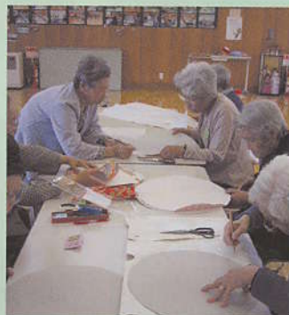
「どうやるの？」 「ここは、こう切って…」