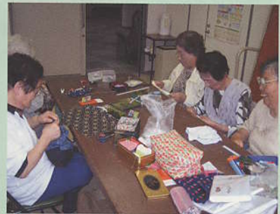
いい夢が見られるように、そば殻入りの枕作り。昔のおはしん思い起こして作った後は、自作の枕でひと休み。