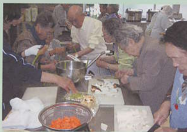
男性も家事は必要です。甲州名物ほうとう作り。後片付けもよろしくね。