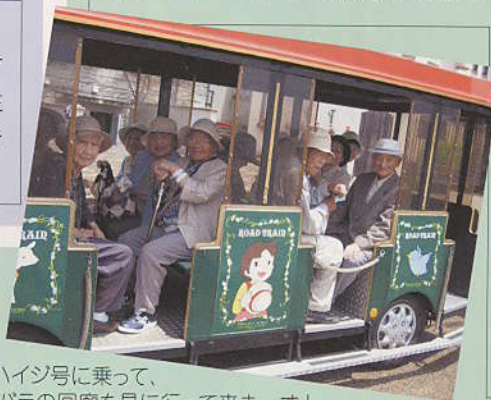
「ハイジ号に乗って、バラの回廊を見に行ってみよう」