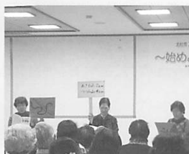
朗読ボランティアの会 みちくさ