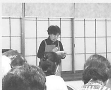
明野町ボランティア 友の会 サン・愛