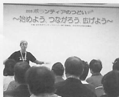
長坂ラフターヨガクラブ