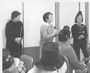
寄り合い所 ふれあい牧