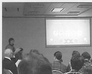
北杜市傾聴ボランティア なの花の会