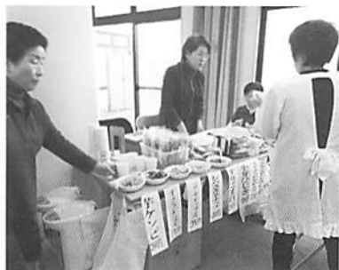
賑わった福祉作業所等の出店コーナー