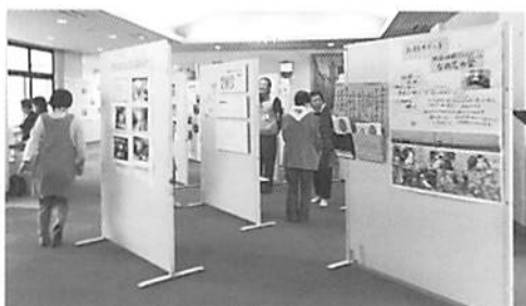
市内14団体のボランティア活動を紹介した展示コーナー