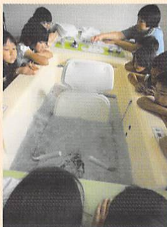
特殊浴槽に興味津々