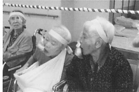
パン食い競争はパンとの闘いです。