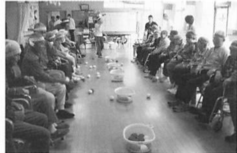
玉入れ 中に入っても弾んでしまうためコツが必要です。