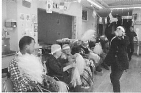
フレー!フレー! 応援合戦 気が入ります。

色別のチームに分かれ、玉入れ・パン食い競争など職員が工夫した分かりやすい競技で楽しみました。