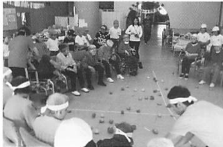
陣取り合戦 どの陣地を攻めようか考えながら投げます。