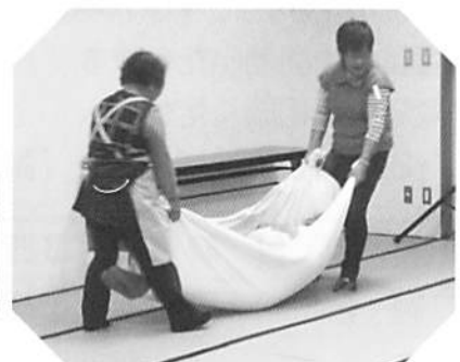
シーツを担架に 「防災デモンストレーション」