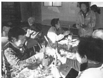
難しいもんだねー

月に1度ですが、健康管理に気を付け、さらに声掛けを広げ、地域全体が元気になるよう輪(和)を広げていきたいと思えます。