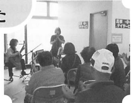
「ウルピカス」によるブチ演奏会

12月1日(土)社協本所に170名以上の皆様がつどい、市内で活動しているボランティアの紹介やボランティア同士の交流の輪が広がりました。