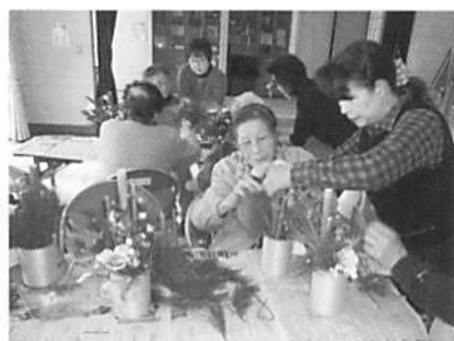
こうにやるだよー