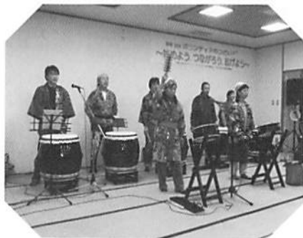
「種まき一ず」による 創作太鼓