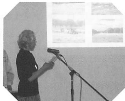
「かぶら de お茶会」 (ふれあいいきいきサロン)