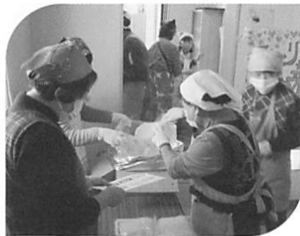
非常食の試食、好評でした。