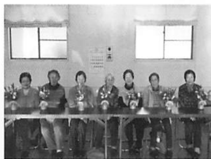
いいお正月迎えられるよー