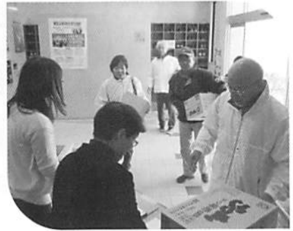
食料支援用の食品提供 ありがとうございます。