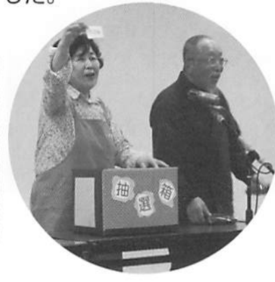
初めての試み「抽選会」 賞品の防災グッズが喜ばれました。