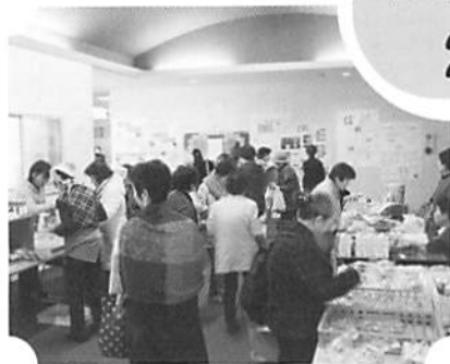
福祉作業所等による出店コーナー

12月1日(土)社協本所に170名以上の皆様がつどい、市内で活動しているボランティアの紹介やボランティア同士の交流の輪が広がりました。