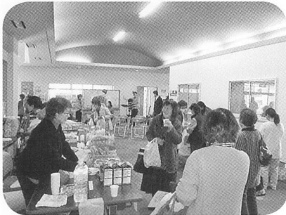
福祉作業所等による 出店コーナー