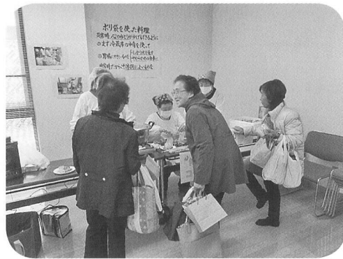
「須玉町ボランティアグループ福寿草」 による非常時の簡単レシピの紹介