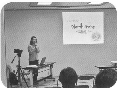
ほくと子育てのもり North tree