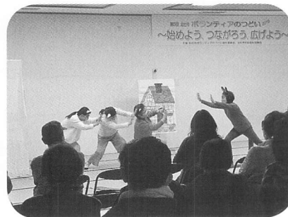
北杜市手話サークル (手話劇)