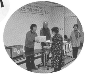
『大抽選会』 賞品の防災グッズは 喜ばれました

12月1日（日）社協本所にて約150名の皆様の参加をいただき、市内で活動しているボランティアの紹介やボランティア同士の交流の場となりました。