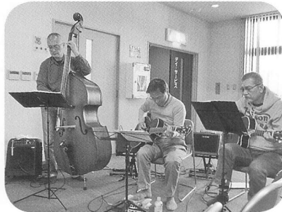
「GAHO」による 昔なつかしい グループサウンズの演奏