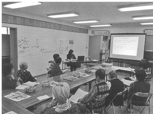
サロンカタクリ（白州）