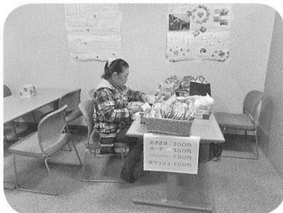
「オレンジサロンわいわい」による 小物づくり