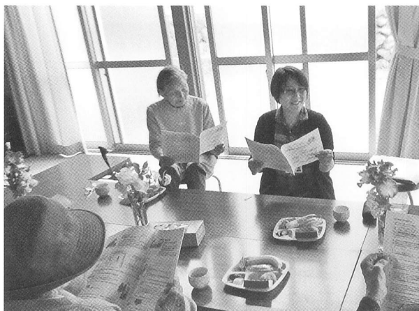
ふれあいきいき桑原（須玉）